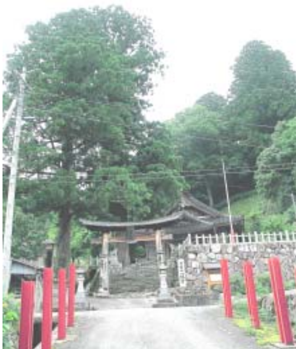
金城町 波佐 「あしお杉」

このため、「浜田市地球温暖化対策地域協議会」を設置し、各実施主体や自治区ごとに地域の実情に応じた具体的な削減事業実施の中核的な役割を担い推進します。