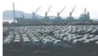
熱田町 「5万トンバース(浜田商港)」

また、工場・事業所での電気や燃料の使用状況の把握、一般的な省エネ対策や業種特性に応じた省エネ対策の実施、 ※ 新エネルギーの導入など、事業活動の中でできる温暖化対策に取り組めます。