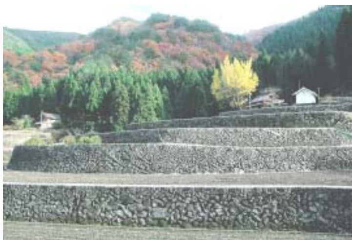
旭町 都川「都川の棚田」

また、進捗状況や達成状況を広報紙や市ホームページなどで公表し、情報の共有を図ります。