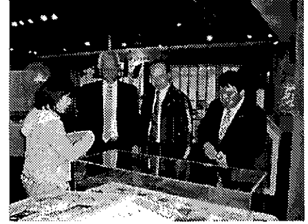
(館内にて説明をうける)

食のまちづくりについては「地域の資源を活かしたまちづくりを進めよう」と考え、その資源として「豊かな食」に着目し全国ではじめての食をテーマにした条例「食のまちづくり条例」が制定された。市民参画の協働によるまちづくりを進めるため、平成13年度から食、食文化の「地区振興計画」を策定し12地区（小学校単位）に年間50万補助、実践活動として3年間で150万を限度に補助してきており、先駆的、重点的な事業が900事業がだされ平成21年度まで実践をしてこられた。この取り組みは食文化館に設置されている小浜市食のまちづくり課主体で推進された。特に食育については、将来のまちの発展を担う人づくりの観点から力を入れて取り組んでおり、子どもたちの料理教室、通称キッズキッチンや地場産学校給食、成人向けの各種料理教室、ふるさと料理の会食など、幼児から高齢者に至るまで、あらゆる世代を対象に、ライフステージに応じた、さまざまな食育事業を実施されている。その生涯食育拠点施設が「御食国若狭おばま食文化館」であり、食文化の博物館でした。（医食同源の観点から、温浴施設や足湯があった）