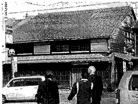
(町屋再生として福祉施設利用)