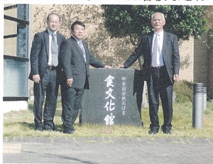
(御食国若狭おばま食文化館)