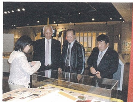
(館内にて説明をうける)