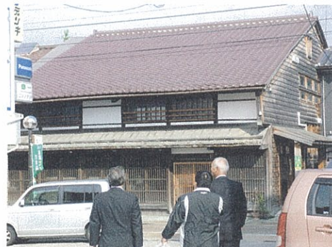
(町屋再生として福祉施設利用)