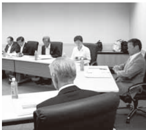
むつ市での視察の様子

6月28日から30日の間 で青森県むつ市では、子育 て支援施策について、五所 川原市では、ごみ処理施設 の活用策と高齢者施策(認 知症サポーター養成)につ いて視察しました。出産や 子育ては、充実した施策を 実施し出生率を維持。また、 ごみ焼却施設廃止後の取 組みは、老朽化による倒壊 の危険がある煙突を跡地 利用計画がないなか、国県 の補助金100%で解体 工事を実施。また、認知症 はサポーターの要請を地 域包括支援センターが主 軸となり、積極的に講座等 を開催。これら先進市で学 んだ成果を本市の行政に 反映させていきます。