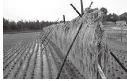
最近では珍しい光景のハテかけ

答 国内の米価下落を背景に「試験相場」が始まった。農産物の価格を事前に決めることで天候等による価格変動するリスクを減らす役割がある。しかし、価格が乱高下し不安定の状況が見られ課題も多々ある。