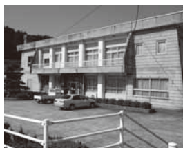
軒束出張所の施設

改正する条例」については、教育施設の指定管理期間を5年から3年にもどすもので、譲渡や廃止の考え方について、市としても統一的な考えが必要である、との意見がありました。執行部からは、それぞれ地域における経緯や事情も異なり、譲渡に当たっての統一的なルールを作るのは、非常に難しい点もあるが、今後、それぞれの部署で事例ごとに基本的な方針を検討し、決定することになる、との答弁がありました。