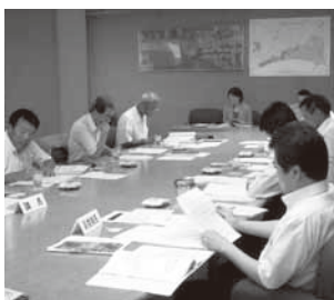
苫小牧市での視察の様子

防災センターでは、災 害について実際に体験し ながら学習することがで き、災害時での行動等で 参考とすることができま した。