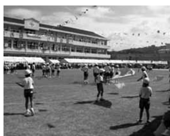
芝生化された周布小学校の運動会

その他の質問 問 学校現場での新たな津波対策の取組みはどうか。 答 県地震被害想定調査検討委員会の中で、浜田沖でのマグニチュード7.3の地震で想定される津波は1.94メートルと伺っている。これにより直接被害が及ぶ学校は少ないと想定されるが、万が一に備えた対応を各学校で十分検討する。