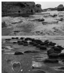
「石見豊ヶ浦」 ジュエルとハッピーシェル

ガイド20名のご協力で、3月から6月及び9月から11月の期間に日曜と祝日の9時から16時半で対応している。事前予約があれば平日も対応している。