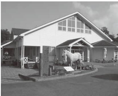
かなぎウエスタンライディングパーク

委員からは、譲渡または廃止となった理由は何か。今後3年間を目途に、施設のあり方を見直し協議がなされるのか。なかでも「かなぎウエスタンライディングパーク」の経営実態は、今日に至るまでの経緯等も含め不安視する内容や評価どおり廃止して、有効活用策について別途検討したらどうか、などの質疑が集中しました。執行部からは、非常に厳しい経営状態にあると承知している。今後、検討を重ねるなかで、十分に重きを置いて向きに取組みたい、と答弁があり、挙手採決の結果、賛成多数で可決すべきものと決しました。