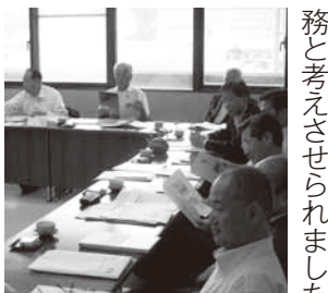
志布志市での視察の様子

6月29日から3日間、 鹿児島県いちき串木野市 と志布志市を視察しまし た。志布志市では、水産 総合研究センターの現地 視察を行い、世界で初め てウナギの完全養殖に成 功、NHKで放映された 映像を視聴しました。い ちき串木野市では、当市 でも取組まれている合宿 誘致促進事業を視察、補 助金の額や利用条件等、 浜田市の方が優れていま した。また食のまちづく り宣言や条例が制定され ており、食と観光とをリ ンクさせた取組みが実践 されており、当市におい ても、こうした食と観光 をリンクさせた施策が急 務と考えさせられました。