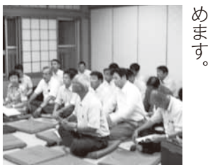
8月18日の京丹後市での 議会報告会の様子

浜田市議会としても、 今後開催を予定している 議会報告会に一人でも多 くの市民の皆様に来てい ただくために何をすべき か、という視点を念頭に 置きながら、市民の皆様 に、より身近な議会とし て生まれ変わるよう努 めます。