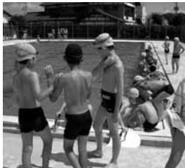
プールでの笑い声の絶えない子どもたち

答弁 水泳教育の重要性は十分認識している。学校プールは老朽化が進行し整備が望まれるが、大がかりな改修や改築は財政的に困難であり、今後は1自治区に1プールでの対応を考えている。