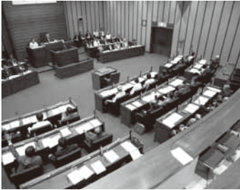
請願の挙手採決時

平成23年9月浜田市議会定例会が9月5日に召集され、9月22日までの18日間の会期で開かれました。提出された条例や予算などの議案は38件、請願は継続審査を含め2件で、審査の様子は2～3ページに、採決の結果は4ページに掲載しております。個人一般質問には18名が立ちました。また、1年間特別委員会を立ち上げ、策定を推進してきた「議会基本条例」が制定されました。