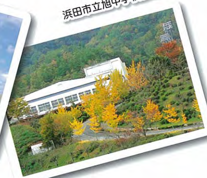
浜田市立旭中学校【5km】