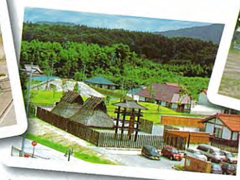
旭ふるさと歴史公園【徒歩1分】