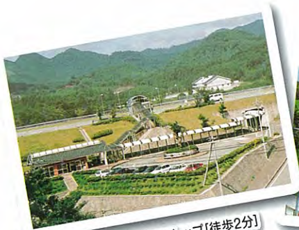
浜田自動車道重富バスストップ【徒歩2分】