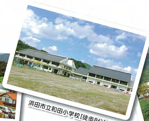
浜田市立和田小学校【徒歩8分】