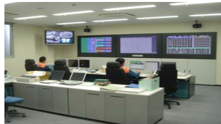
高機能消防指令センター整備事業 (事業費2億1,519万円)