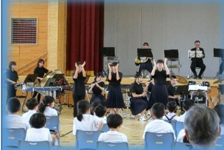
9日 旭小コンサート