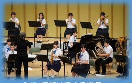
3日 西部地区吹奏楽祭