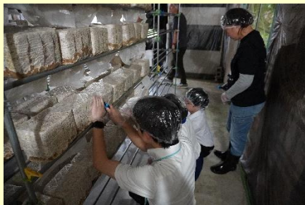
きくらげ菌床に切り込み作業

毎年恒例の西部地区吹奏楽祭に加え、小中連携として初の試みの小学校での演奏会、コロナ禍があけ久しぶりに開催されご招待いただいた市木地区のほたる祭りで演奏をしました。コンクールに向け確かめたり、小学生や地域の方に喜んでいただいたりと充実した演奏会でした。新しく入部した1年生にとっても貴重な経験の場となりました。