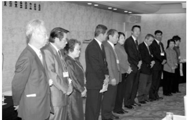
懐かしい石見神楽に大盛況

そして、総会後の設立祝賀会においては、安城社中による石見神楽の上演が行われ、会場に訪れた弥栄出身者の皆さんは、懐かしい太鼓の音色を聞きながら、昔話に花が咲いていました。