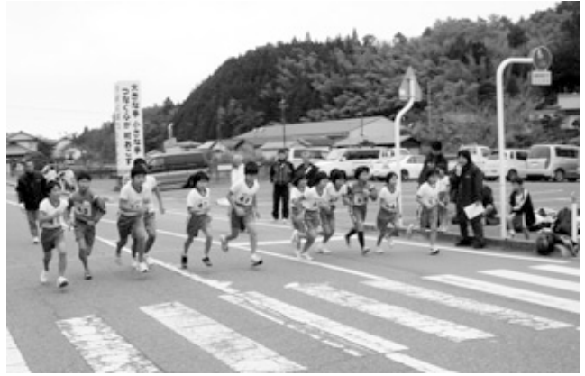
一生懸命走る小中学生