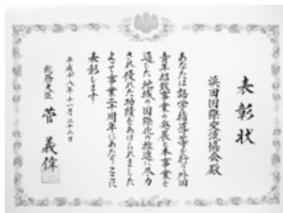
浜田国際交流協会