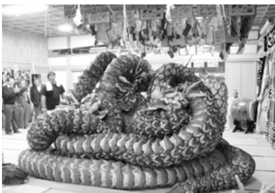
「石見神楽」にとことんこだわった旭分科会。参加者と地域が一体となって楽しみました。