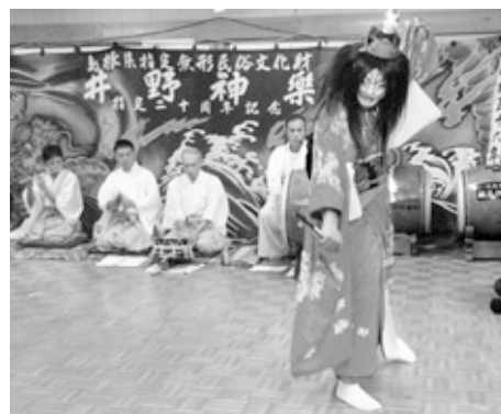
井野神楽による「貴船」の一場面

この後、三社中および地元青年団による神楽も上演され、来場者を楽しませていました。