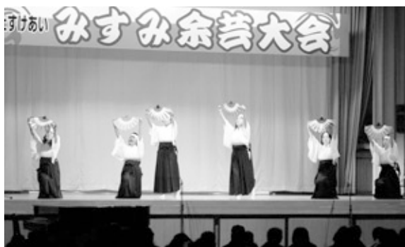
三隅自治振興会の皆さんによる 舞踊「富士山」

今年も、踊りあり、劇あり、合唱ありと様々な出し物を披露。三隅町民合唱団は残念なことに、この舞台を最後に解散することを発表され、最後の曲として「浜田市民歌」を熱唱されました。