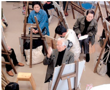
石本 正 絵画教室