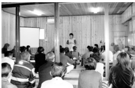
「生きる力を育み、住みたくなる里づくり」をテーマに「グリーンツーリズム」のあり方について全国の実践者と内容の濃い意見交換を行いました。