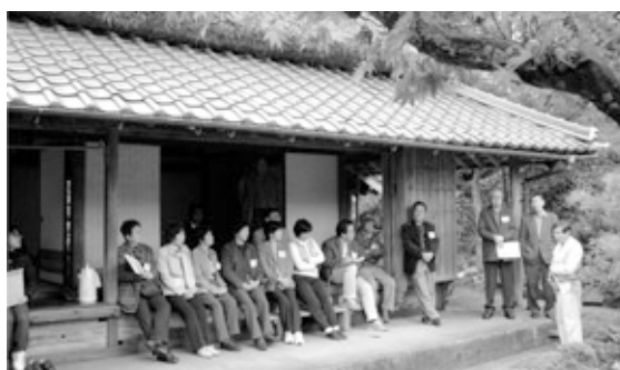
「やさか仙人ふるさと体験ツアー」と題して、弥栄に住む七人の仙人を訪れました。個性豊かな仙人たちの感動的なもてなしで、参加者との絆が深まった3日間でした。