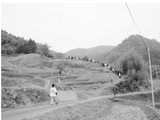
日本の棚田百選の一つ、室谷棚田を散策しました。