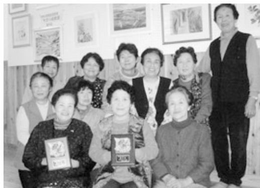
ちぎり絵教室の皆さん