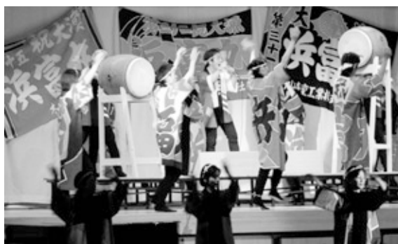
ミレ岡見の皆さんによる 踊り「おかみさんソーラン」