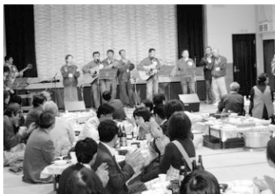
"テーマは「音」"太鼓の音、人の声、里の響き、神楽の囃子 いろんな音で参加者を歓迎しました。