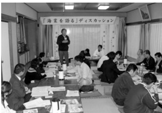
テーマ「海業」について、熱く議論しました。また、「男の料理教室」も参加者に好評でした。