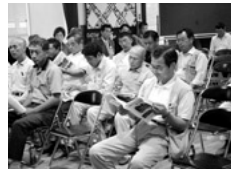
設立総会時の様子

少子化や高齢化が進む中、明るく元気な地域を目指して、農作業の受託、農産物の受託販売、休耕田の保全対策などに加え、地域の文化・伝統芸能への支援や高齢者の生活支援などの地域活動も計画しています。