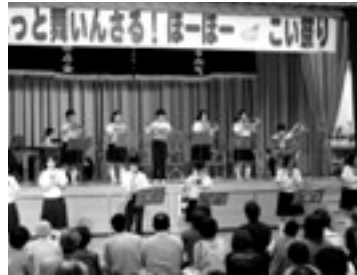
昨年に引き続き舞台を盛り上げる旭中学校吹奏楽部

メインとなるほたるの鑑賞も予定どおり行われ、闇に浮かび上がる幻想的な灯りに、参加者は酔いしれていました。