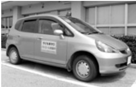
青色回転灯を装備したパトロール車

防犯意識の高揚と犯罪防止を目的に、金城地区防犯パトロール隊（通称：青パト隊）を、地区の有志22人（うち1法人）で結成し、7月16日（水）、雲城小学校校庭において出発式を開催しました。