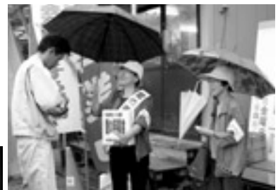
雨の中にもかかわらず、たくさんの人に、協力してもらいました