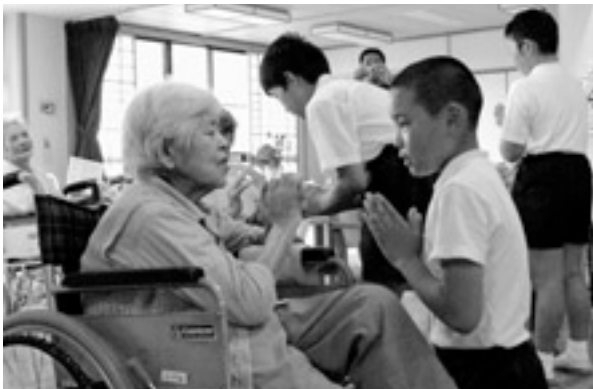
手と手をあわせて♪夏も近づく八十八夜♪

会が終わってから児童の手をとり話かける人もいて「元気をもらった」と、とてもうれしそうでした。