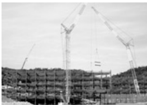
浜田医療センター工事風景 (11月上旬現在)