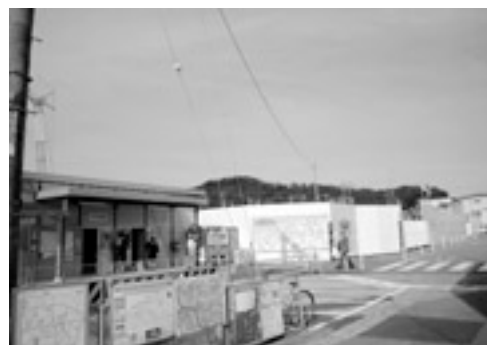
駅北開発工事風景 (11月上旬現在)