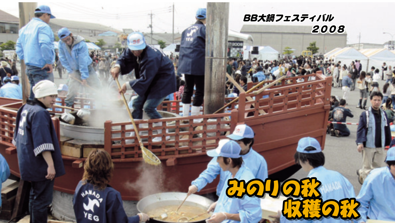
BB大鍋フェスティバル 2008