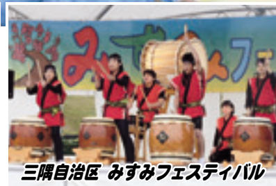
三隅自治区 みすみフェスティバル