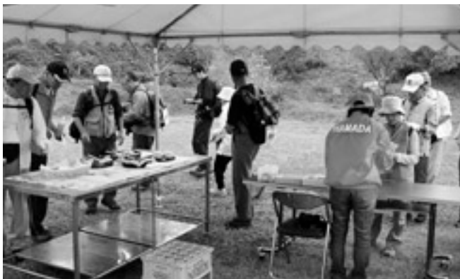
針藻山でしばしの休憩を取る参加者

当日は、三隅中央公園を出発し、田の浦海岸や福浦漁港などの海辺部をめぐる経由地の針藻山で休憩しました。