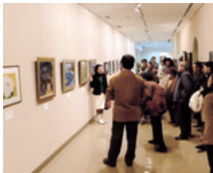
昨年の水澄みの里作品展