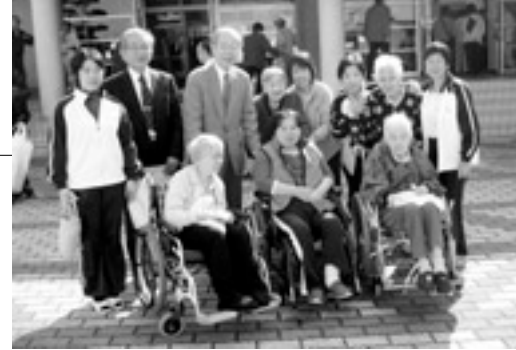
11/1 (土) 第21回さざんか祭りにて