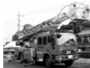
消防はしご車体験。 「どこまで 上がるか楽しみ」