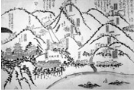
慶応2年合戦之取合図

石見地方において幕末に戦火が開かれたのが、慶応2年（1866年）の第2次長州征伐（石州口の戦）です。この戦争で山口の長州軍に攻め込まれ、浜田は戦場となりました。このかわら版は、このときの合戦の様子をいち早く報じたものです。