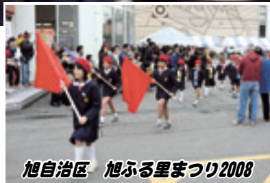
旭自治区 旭ふる里まつり2008