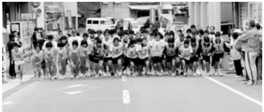
恒例の旭ロードレース大会。各部門にわかれ 110人の選手が参加しました。