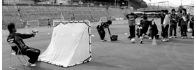
キッズサッカーコーナー 今年は、キッズサッカーコーナーがあり、 元気な子どもたちがフリーキックなどに チャレンジしていました!!