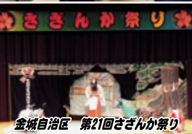
金城自治区 第21回さきさんか祭り