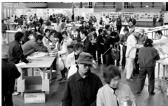
農林産物の即売の様子