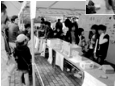
初参加のベンチャーキッズスクール 小学生による手作り品販売コーナー