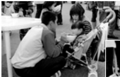
各地の素材がふんだんに入った お汁は格別です。