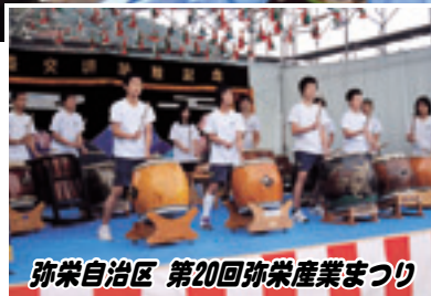
弥栄自治区 第20回弥栄産業まつり