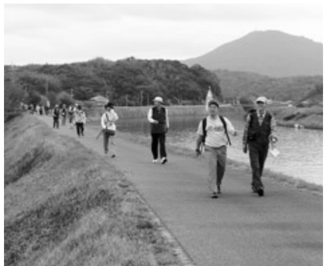
完歩目指してがんばりました。

そして、三隅川堤防沿いに登ってゴールの三隅中央公園に到着。参加者たちは完歩証を片手に、用意されていた西条柿を美味しそうにほお張っていました。