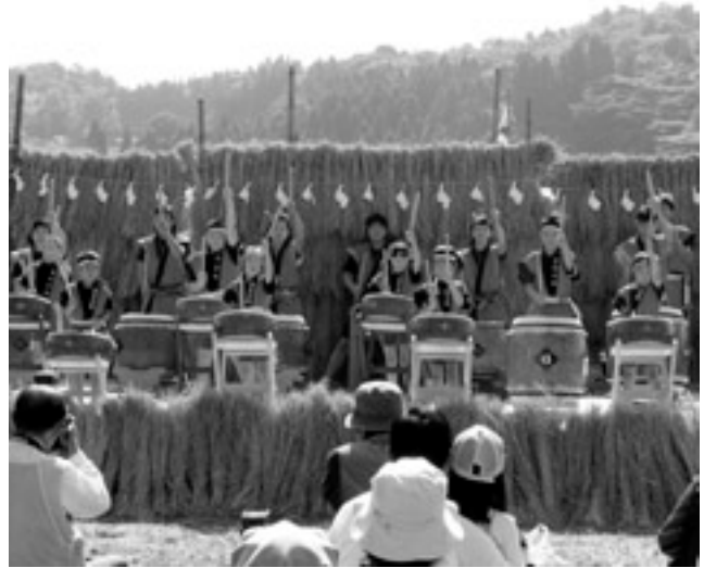
和太鼓の迫力ある音が棚田に響き渡りました。

また、棚田をバックにしたステージでは、室谷分校の児童による「子ども和太鼓」と同好会の皆さんによる「みすみ太鼓」の競演や石見神楽の上演、棚田米すくいなどがあり、穏やかな秋の一日を楽しみました。