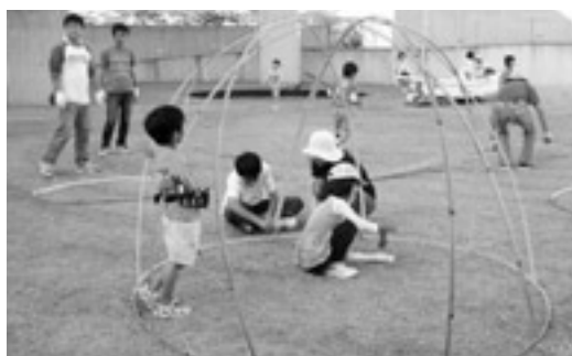
こんな形に完成! この作品は、世界こども美術館で活用されます。 どんな風に活用されるか、お楽しみに!