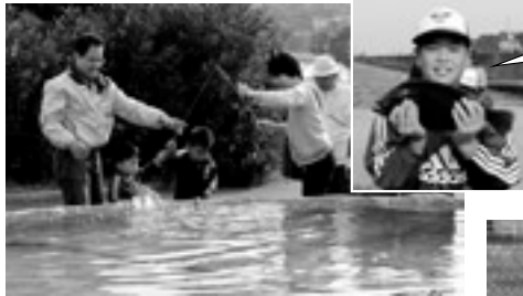
釣堀コーナー 釣った魚は会場で食べられます。