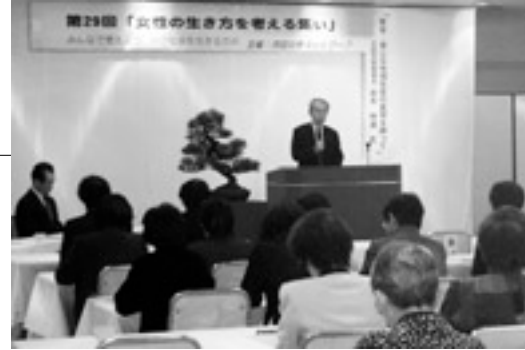
1月27日(火) 「女性の生き方を考える集い」にて