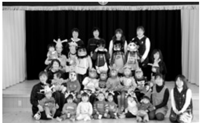
かわいい鬼の集合