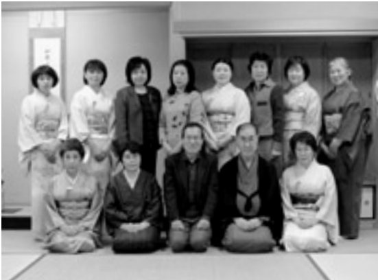
初点式を終えた浜松の会の皆さん

「浜松の会」は、年齢を問わずお茶の愛好家が集まって平成11年に結成され、大平桜まつり、石州心の旅