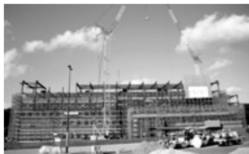
浜田医療センター工事風景（1月下旬現在）