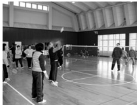
シャトルを相手のコートめがけて打つ選手たち