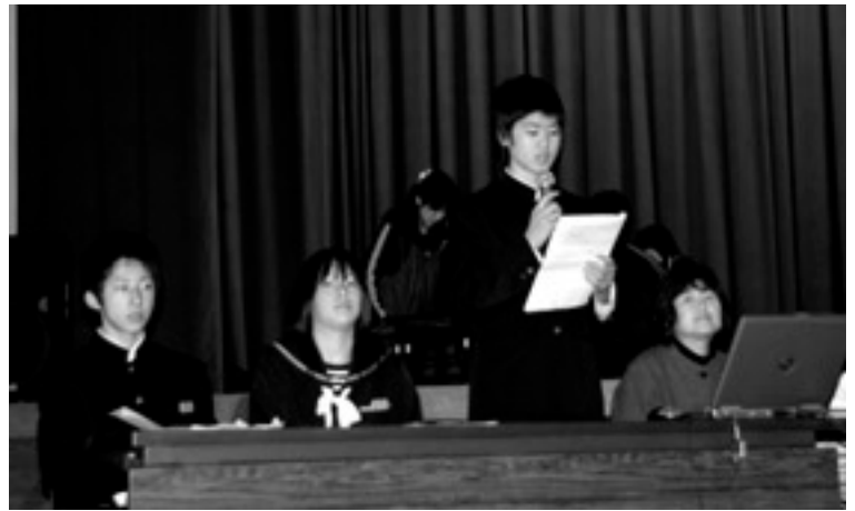
事例発表を行う生徒

ステージでは、6グループが日頃の交流の成果を発表し、事例発表では「未成年の飲酒は絶対ダメ!」という演題で、弥栄中学校の生徒が普段の生活などを踏まえ、問題提起を行いました。