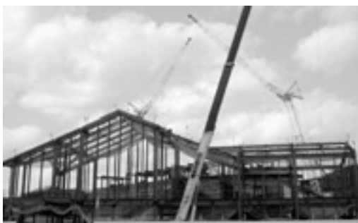
駅舎工事風景（1月下旬現在）