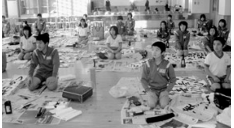
真剣に注意を聞く児童

児童は、冬休みに練習した成果を十分に発揮し、新年の想いを字に込めて力強く書いていました。