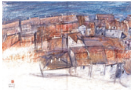
石本正「ロヴィニ」(1983年)

10世紀から12世紀にかけてヨーロッパ各地にヨーロッパと東方の文化を融合させたロマネスク美術が発展し、各地に地方色豊かな文化が華開きました。写実にごこだわらない自由な表