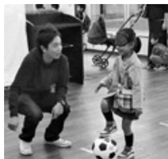
アイマスクをしてサッカーボールをゴールへ！

地元住民の協力のもと、目の不自由な子どもも楽しめる遊びの紹介や盲導犬とのふれあい、またポニー乗馬体験や消防車の展示など盛りだくさんの内容で、会場はたくさんの親子連れでにぎわいました。