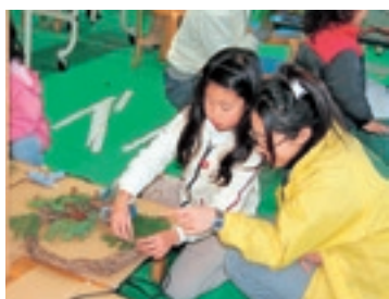
クリスマスリースづくり