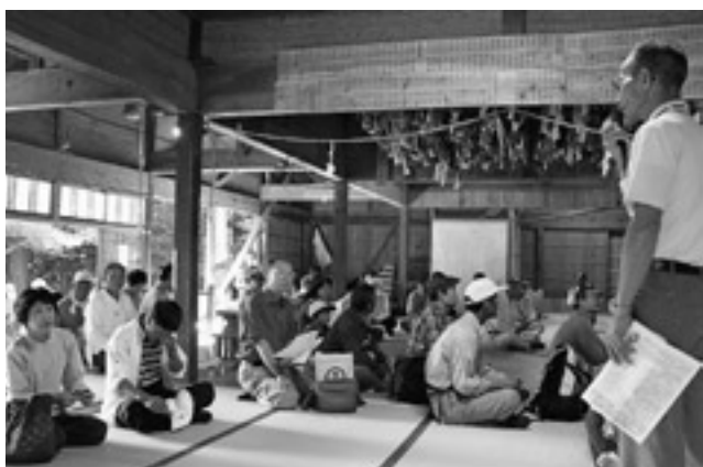
地元ガイドの説明を熱心に聞き入る参加者