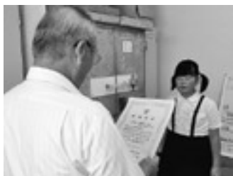
大会マスコット表彰式の様子