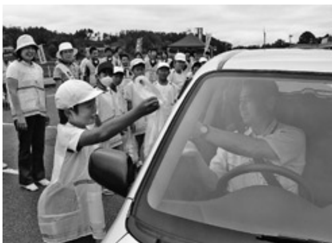
安全運転を呼びかける児童