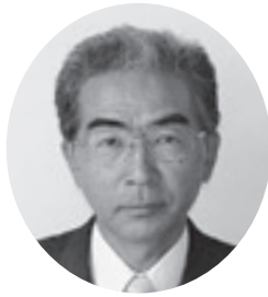
にしむら けん 58 西村 健 58 日本共産党