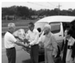
木田自治会長から委託業者旭タクシーの運転手さんへ花束の贈呈！

交通手段の確保が難しい高齢者や免許のない人が、日常の買い物や通院で支障がでないようにするための新しい交通システム（予約型乗合タクシー）が10月から本格運行を開始しました。