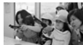
射的でお菓子をゲット！