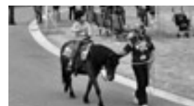
ポニーへの乗馬体験