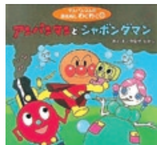
◎やなせたかし「アンパンマンとシャボンダマン」2007年