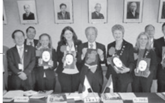
10月22日(木) 国際ロータリー第1160地区 アイルランドGSEチームの皆さんと