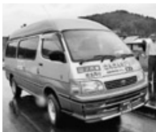
地域の新しい交通手段となる「さんさん号」