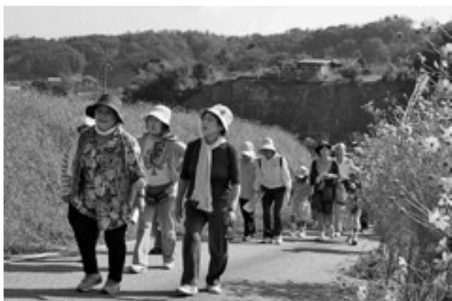
秋の自然に触れながらウォーキングする参加者