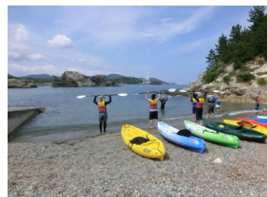
屋外活動クラブの様子（7/19 カヌー体験）