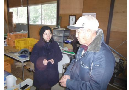
太田農園 (加工施設)