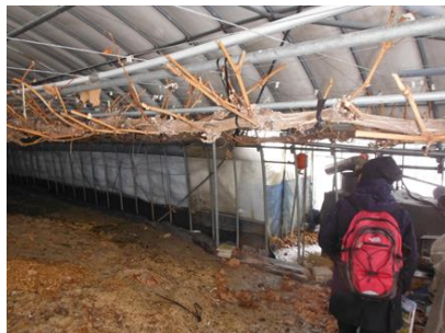
(株)藤若農産 (ぶどうハウス)