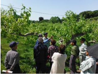
西条柿栽培講習会状況

いちじくについては、日脚町の圃場において、「芽かき」や「敷わら」、「摘心」・「病害虫等防除」について講習がありました。各組合の皆さんは、熱心に栽培管理について講師に質問され、栽培技術の向上に取り組まれました。