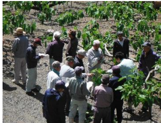
いちじく栽培講習会状況