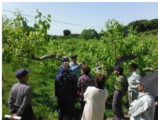
西条柿栽培講習会状況

いちじくについては、日脚町の圃場において、「芽かき」や「敷わら」、「摘心」・「病害虫等防除」について講習がありました。各組合の皆さんは、熱心に栽培管理について講師に質問され、栽培技術の向上に取り組まれました。