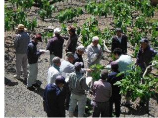
いちじく栽培講習会状況