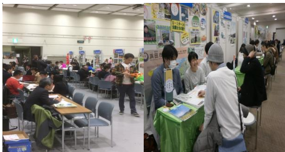
昨年度のフェアの様子