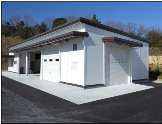
【完成した集出荷施設】

JAしまね いわみ中央地区本部では、大粒ぶどうの産地強化を進めるとともに、振興作物である「なす」、「キャベツ」、「菌床椎茸」を取扱い、集出荷を行っています。特に、大粒ぶどうは、具体的な振興策をまとめた『ぶどう産地振興ビジョン』を策定し、産地拡大を図っているところです。