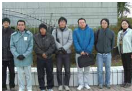
意見交換会が終わった後は、アクアスを見学して交流を深めました

昨年12月17日、金城町の「みどりかいかん」で、浜田市のふるさと農業研修生5名と関係機関による意見交換会が開催されました。