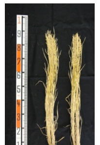
図1 稲の草姿 左：島系72号 右：ハナエチゼン

http://www.pref.shimane.lg.jp/nogyogijutsu/tokimeki/408.html