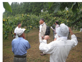
▲出雲市からの視察