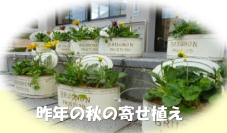
昨年の秋の寄せ植え