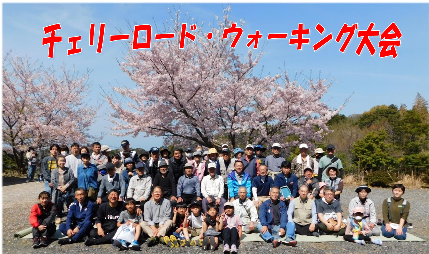
↑満開の桜の下で記念撮影