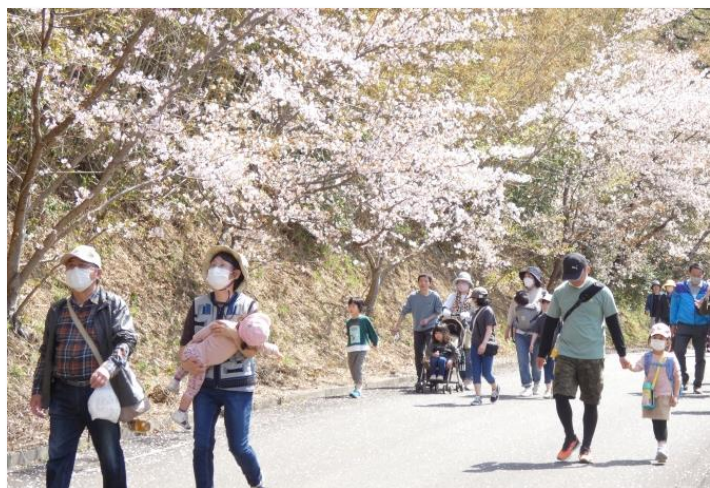
↑小さなお子さんと親子で参加される方も多かったです

ラジオ体操で体をほぐした後に、須津の漁業振興会館から青浦集会所を目指して歩きました。昨年よりも桜の開花状況がよく、良いお天気の中、桜をゆっくり眺めながらウォーキングを楽しみました。