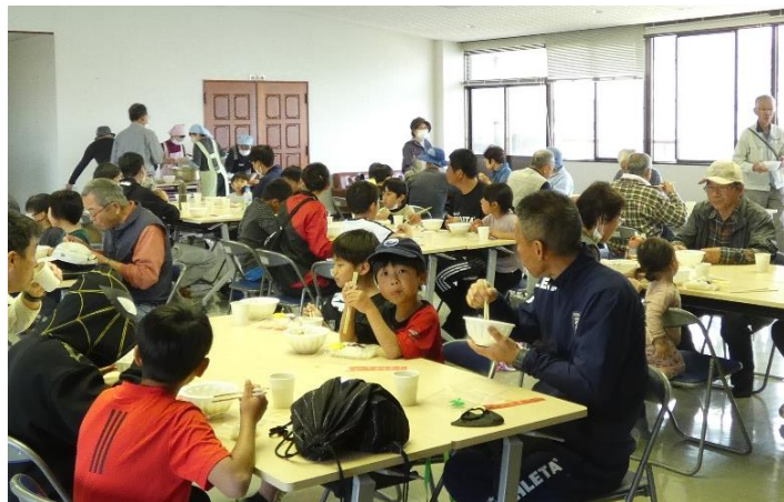
↑ウォーキング後、美味しい豚汁をいただきました

青浦集会所で休憩を取った後、桜の木の下で記念撮影をしました。往路は、食生活改善委員さんと自治会の女性チームに作っていただく豚汁を楽しみに歩きました。今回も自治会役員の方々の安全見守りのお陰で無事に終了しました。