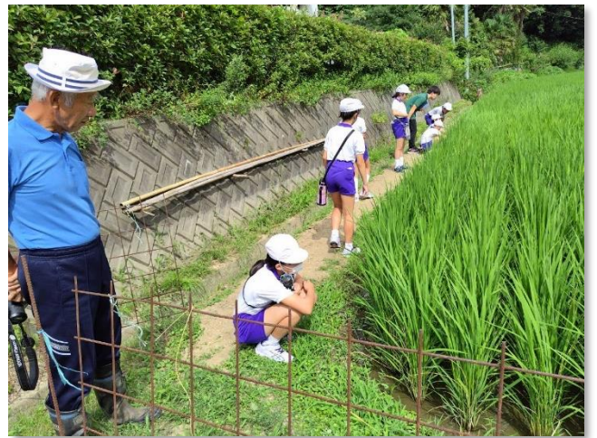
→5月に植えた苗がこんなに大きくなりました。