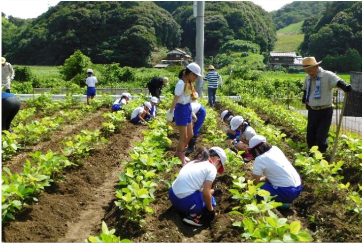
↑手順を教えてください、熱心に作業をする児童たち。

7月6日（木）大豆畑の草取りと元寄せを行いました。作業はいつものように「畑の応援団」のみなさんをお願いしました。途中、岡見小3、4年生も作業に加わり、2時間余りの作業で、草だらけだった畑は大豆がはっきりわかるようにきれいになりました。これからの成長が楽しみです。