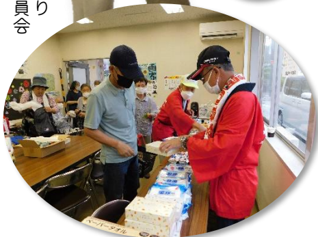
抽選会 ← や店内 → の様子