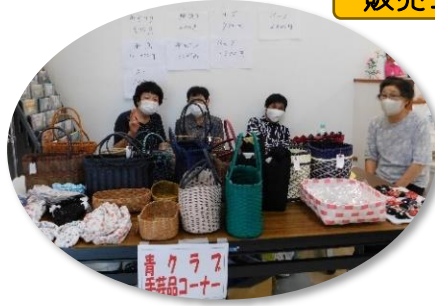
青クラブのみなさん