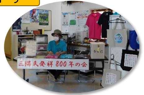
三隅氏発祥 800年の会さん

舞台上では、様々なパフォーマンスが披露され、会場から大きな拍手や声援が送られました。