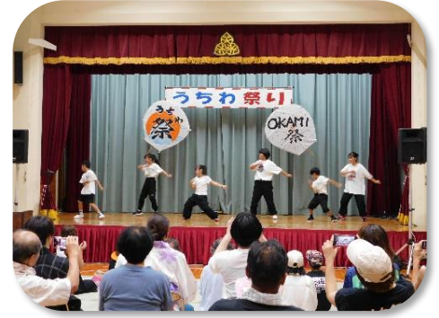
オーケー・クルー キッズダンス