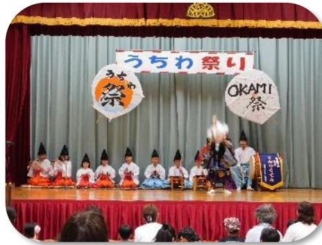
てんつくてん 子ども神楽