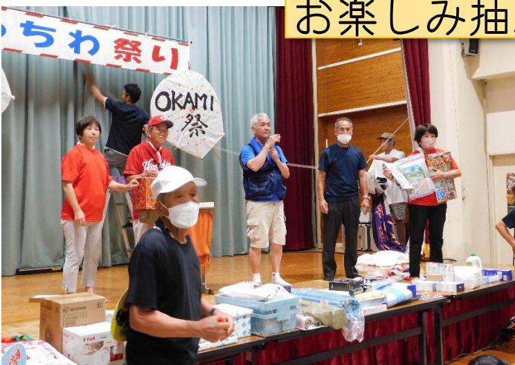
景品は、花火やラーメン、お米、サーキュレーター など 50 本余り。1等は焼肉グリルでした。