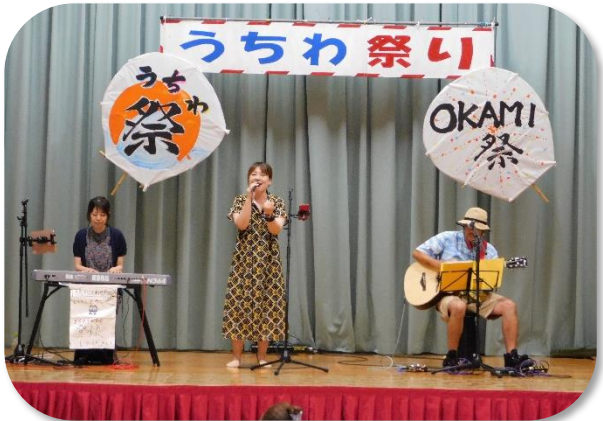
バンド「鳩時計」の演奏。素敵な歌声が 会場に響き渡りました。