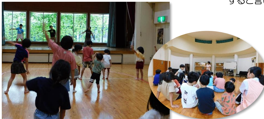
今日のお話は何かな？

お兄さん、お姉さんたちの動きをまねて、園児のみなさんも一生懸命に体操をします。体操の後は、仲よくお話を聞きます。膝の上に乗ってお話を聞く園児もいます。終わるとそれぞれの部屋に戻りますが、お互いなかなか離れがたい様です。