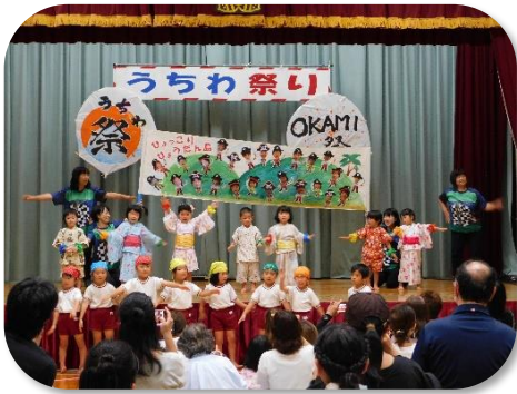
岡見保育所園児 歌とダンス

舞台上では、様々なパフォーマンスが披露され、会場から大きな拍手や声援が送られました。