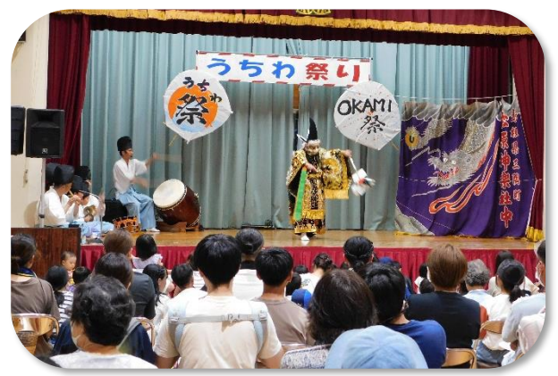
松原社中の神楽「鬼返し」。会場に鬼が下り てきて、子どもたちは大騒ぎでした。