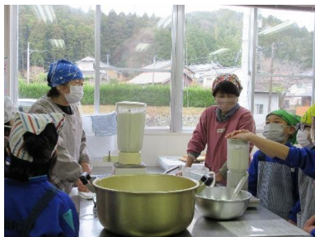
水につけておいた大豆をつぶす →