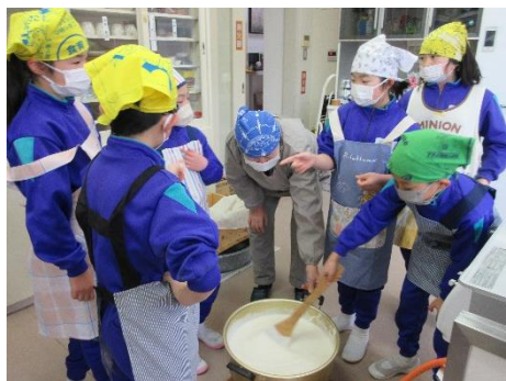
焦げないように混ぜながら煮立たせる →