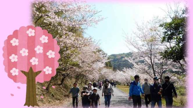
昨年も地域の方が多数参加され、大変賑わいました。