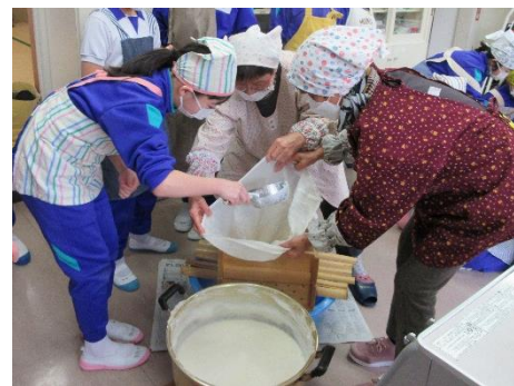
袋に入れて豆乳とおからに分ける