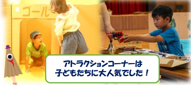
アトラクションコーナーは子どもたちに大人気でした!