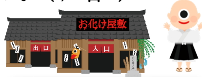
お札を集めて景品と交換