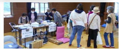
ガーデニング教室のバザーも大盛況