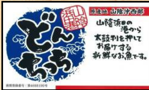
【 沖底船用 船名シール 】

☆沖底船用船名シールは、どの船が獲ってきたどんちっちなのかが一目で分かるように、鮮魚出荷の際に魚箱に張り付けるためのものです。