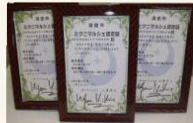
★三魚とも認定証をいただきました！

「浜田の特産品ミクニマルシェ」という付加価値が新たに加わり、どんちっち三魚の魅力は一段とUP！ブランドの更なる飛躍が期待できそうです。