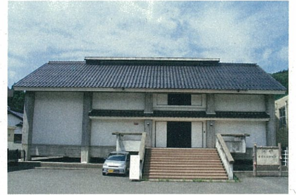
旭歴史民俗資料館