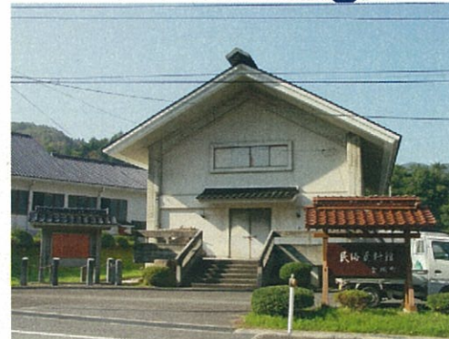
金城民俗資料館・金城歴史民俗資料館