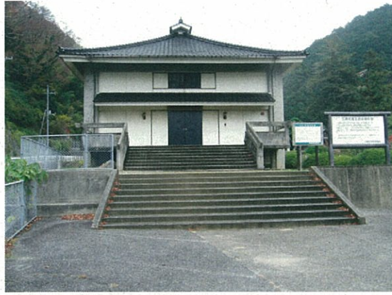
三隅歴史民俗資料館