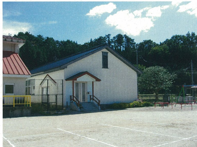
弥栄郷土資料展示室