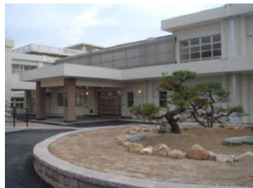
国府小学校新築事業 (事業費12億7,213万円)