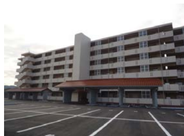
長浜西住宅建設事業 (事業費10億2,737万円)