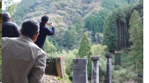
「アーチ橋と橋脚群が素晴らしい」 「貴重な景色を堪能した」といった感想がありました。