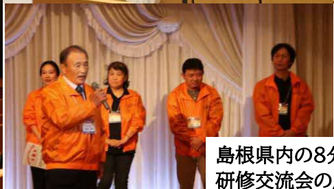
島根県内の8分科会が揃い、 研修交流会の成果発表を行いました。