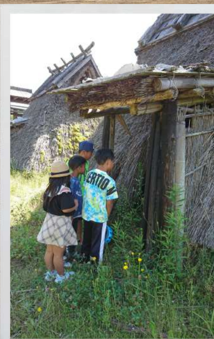
● ごめんください ● ● 4人の母ちゃん ●