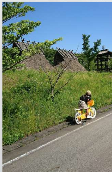
坂道きつ〜い 4人の母ちゃん