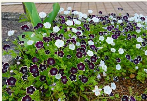
私はこの花を『ゴスロリ』と名付けたよ メレブ