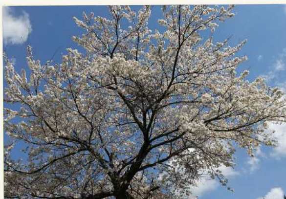
● 春到来 ● ● 遊びおじさん ●