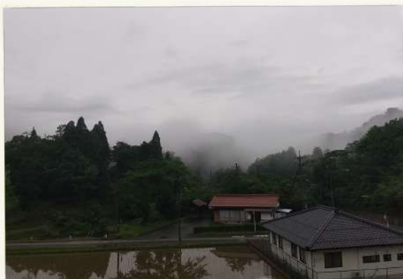
● 霧の朝③ ● ● 鷹の爪団 ●