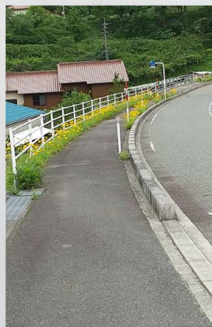
● オオキンケイギク② ● ● 鷹の爪団 ●