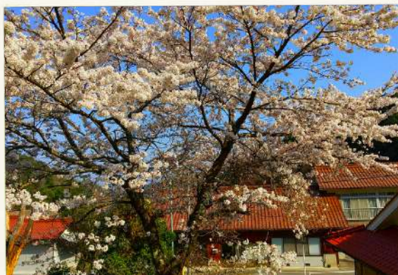
和田の一本桜 遊びおじさん