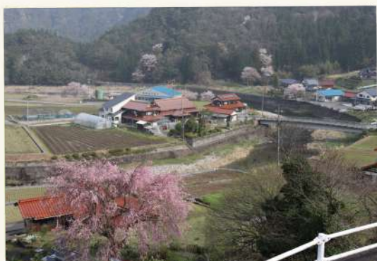
戸川のお花見日和 KAVU