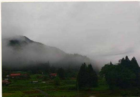
● 霧の朝② ● ● 鷹の爪団 ●