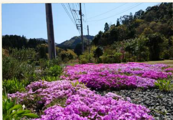
しばざくら 「し」が「う」ならボコボコにされる