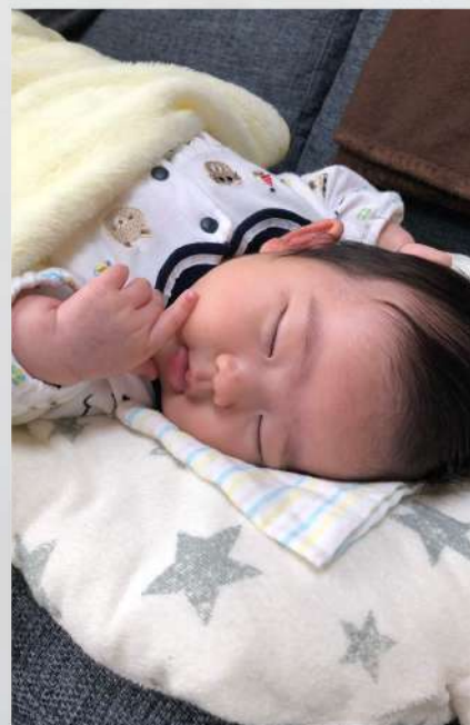
うーん、マダム チャールズ・ブロンソン