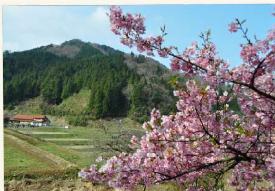
桜の次は蛍の季節是非みに来ちゃんさい 本郷の ой さん