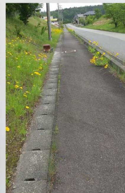
オオキンケイギク① 鷹の爪団