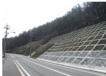
25年公共土木施設災害復旧費 (事業費5億1,173万円)