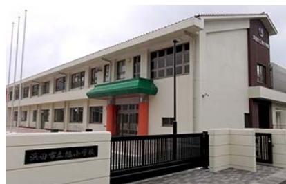
旭小学校新築事業 (事業費12億104万円)