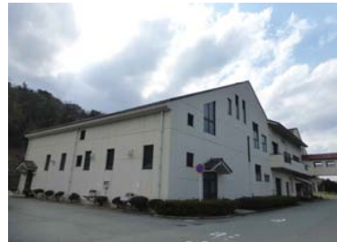
浜田浄苑環境整備事業 (事業費6億6,806万円)