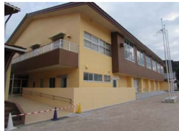
弥栄小学校体育館改築事業 (事業費1億9,747万円)