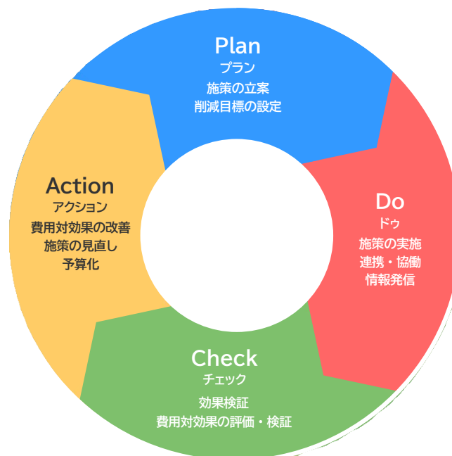
図 進捗管理のイメージ