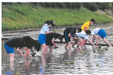
3年生は最後の田植えです