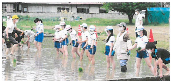
美川小学校の5年生、美川幼稚園の園児・保護者も一緒に活動しました