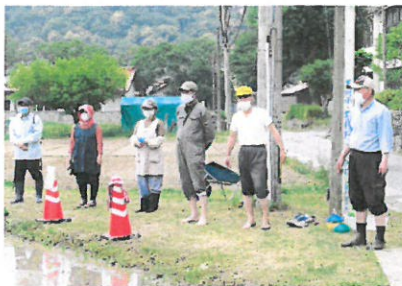
地域ボランティアの皆さん

田植えの事前打ち合わせ、代かき、当日の作業の指導等、地域の皆さんには大変お世話になりました。ありがとうございました。今後は9月の収穫に向けて、稲の世話、観察を行います。