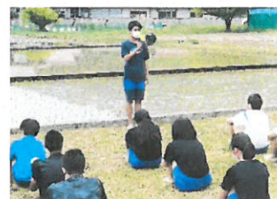
終わりの会 感想発表