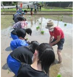
教えていただきながら