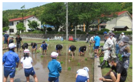
美川の総合力で完成