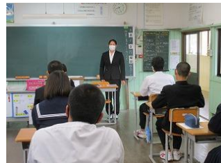
先輩が教育実習に