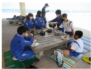
ご飯とカレーの出来は…