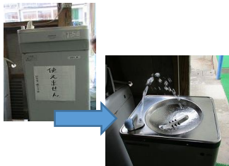
夏本番を前に冷水器新調