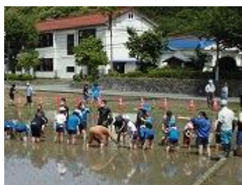
休憩までに一枚植え切る