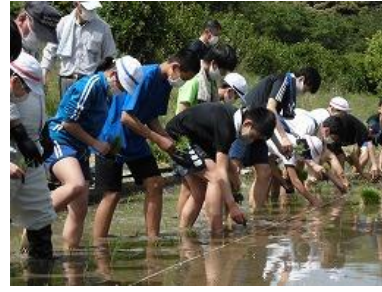
小中そろって開始