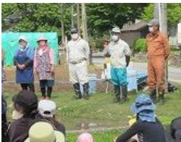
地域ボランティアの皆さん

田起こし代かきから、当日の作業の指導に至るまで地域の皆様本当に世話になりました。ありがとうございました。これから9月の収穫に向けて、稲の世話、観察を行います。