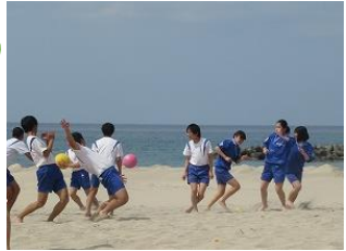
全力ドッジボール