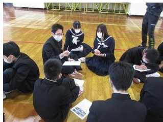
盛り上がる話し合い