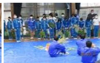
園児さんも小学生も帰るときに気持ちのいい挨拶でした