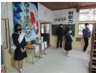
朝 昇降口での選挙運動

12月を迎え、生徒会も代替わりの時期となりました。生徒会の役員選挙には男女各1名の立候補者があり、信任投票となりました。立候補者は応援者と一緒に熱心に選挙運動に取り組み、立会演説会では堂々と考えを述べました。