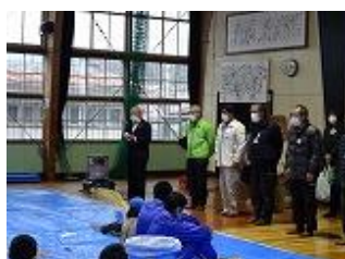
講師の皆さんを紹介

今年度も、地域の皆様のご支援ご協力により、わらやミカン、ゆずり葉、ウラジロを揃えていただきました。まちづくりセンターをはじめ、指導講師としてご来校いただいた地域の皆様には大変お世話になりました。ありがとうございました。