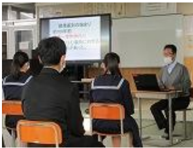
事前学習で今までのまとめ

事後の感想にも「見たい情報に囲まれる＝フィルターバブル」「信じたい情報を信じる＝認知バイアス」といったネット社会の危険性や「無知、無理解、無関心」が差別を助長することがわかったというものが多くありました。また、デマに惑わされないように気をつけたい、差別的を許さない気持ちを持つようにしたいと、今後の自分に結び付けたものもたくさんあり、人権感覚を磨く良い機会となりました。