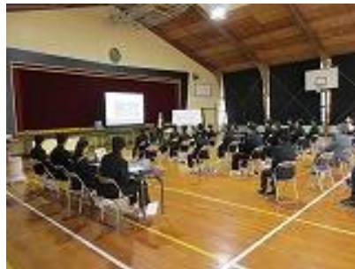
保護者、市役所の方も参加