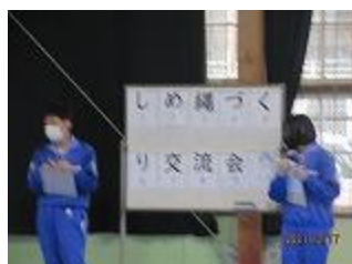
恒例のしめ縄クイズ