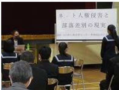
講演後は全員が感想を発表しました