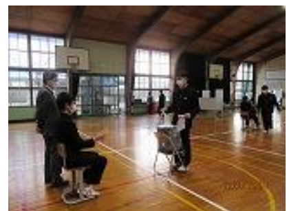
投票箱は市から借用した本物