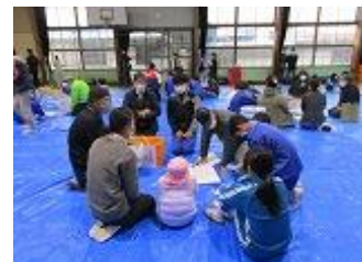
輪になって自己紹介