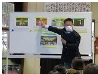
校長挨拶にもしめ縄が