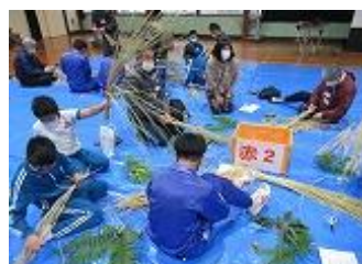
みんなでおおわらわ？