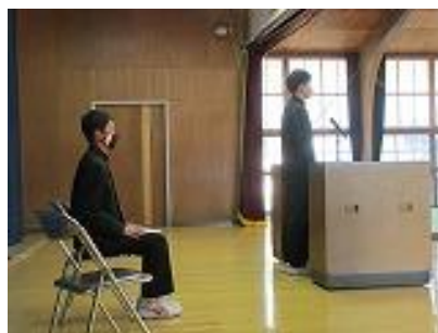
自説をしっかりと主張