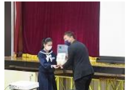
お礼に四中米をプレゼント