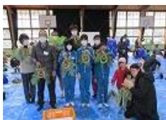
しめ縄をもってパチリ