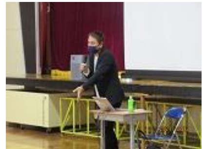
ネット社会の差別問題について