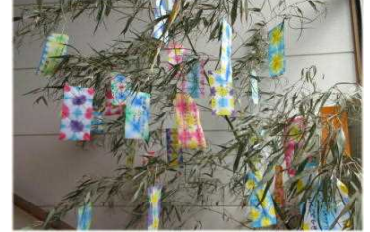
七夕飾りに願いを込めて！

子どもたちは、今できることを大切に、小さなチャレンジを積み重ね力を伸ばしました。個々の成長については個人懇談や通知表でお知らせします。