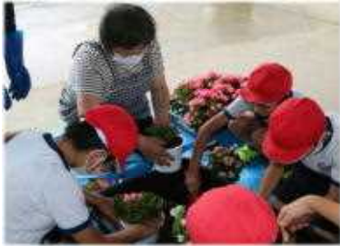
お花のプレゼントの用意。これからしっかり世話をします。

新年度をスタートしてすぐの休校。再開はしたものの、行事の中止や制限のある生活、という状況下でしたが、コロナ禍に負けない子どもたちでした。(保護者の皆さんも負けていません。親子活動の計画ありがとうございます。楽しみです。)