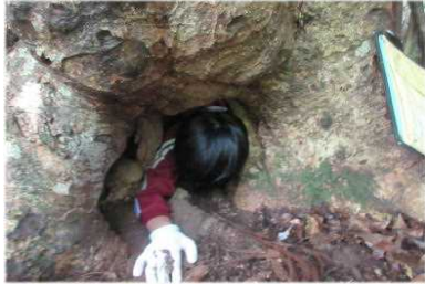
“ホウノキくぐり”くぐれた？

八幡宮の裏山のカシ林の自然散策遊歩道で自然散策をしました。八幡宮に到着すると「いいにおいだなぁ」というつぶやきが聞こえました。山のおいをいい匂いと感じることができる波佐の子は「ふるさとを語れる子」です。