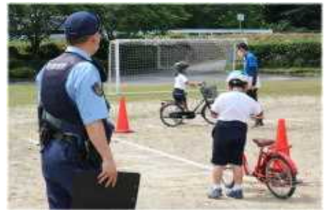
自転車教室 しっかり教えてもらいました。

たくさんの地域のみなさんが子どもたちの登下校を見守ってくださっています。集合場所で待ち構え優しい笑顔で声を掛けてくださったり、通学路を一緒に歩いてくださったり、「元気ですかー！」と気合を入れてくださったり…。おかげで安全・安心・笑顔で登下校することができます。ありがとうございます。