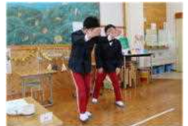
オリジナル漫才の1シーン

6年生がお世話になった先生方をもてなそうと謝恩会を開いてくれました。まずは、思い出のスライドを見ながら、味わい深く歯ごたえのあるパンケーキをいただきました。次に、みんなでポッチャをして楽しめました。最後に、プレゼントとしてオリジナルの漫才を披露してくれました。30分間の短時間でしたが、6年生の個性が詰まった嬉しい会でした。