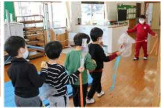
一日入学 低学年のリーダーとして頑張ります