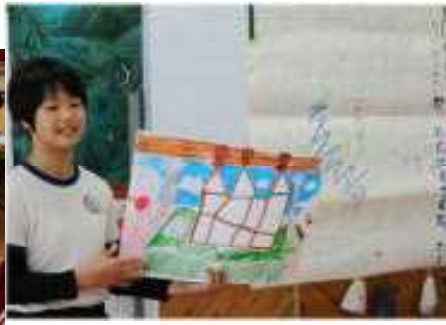
甚左衛門さんクイズ 全校盛り上がりました