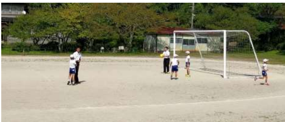
10月1日の昼休みに校庭を覗いてみると、黒い制服を着たお

兄さんたちが、小学校の児童と混ざって遊んでいました。このときには、男子生徒の皆さんが、小学校の児童と遊んでいましたが、女子生徒の皆さんが来て、一緒に遊んでいる姿を見ることもあります。昨年度あたりから、このような光景がよく見られるようになりました。中学校や幼稚園との交流活動を繰り返す中で、今はこれが当たり前ようになってきています。