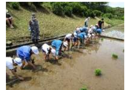
田植え：園児・中学生・地域の方と一緒に