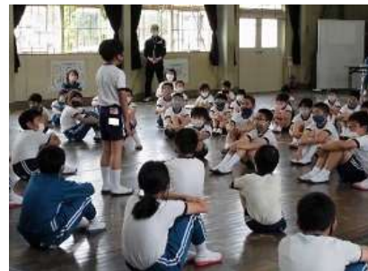
児童総会：発表する友達を見守る