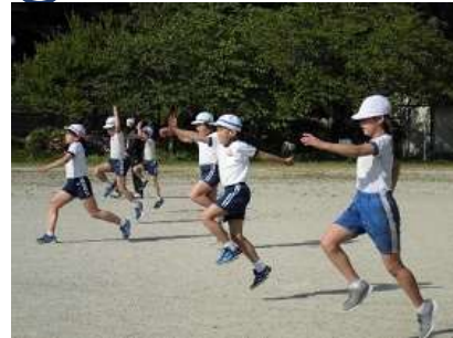
陸上練習：目標に向かって全力で練習