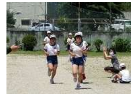
マラソン記録会：最後まであきらめない