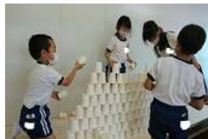
図工：みんなで力を合わせる