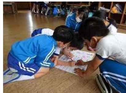
なかよし班スタート式：仲間を支える