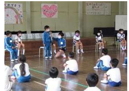
1年生を迎える会：みんなで1年生を歓迎