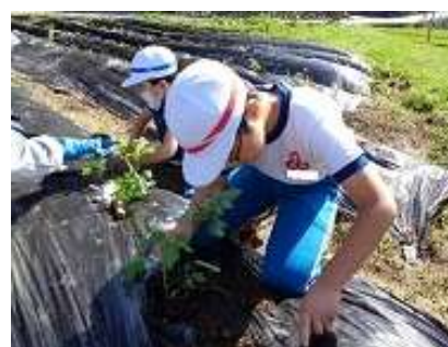
自立活動：何事もやってみる