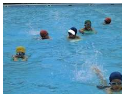
体育：寒さなんかに負けない