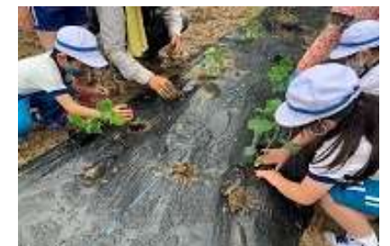
生活科：雨にも負けず野菜の苗植え