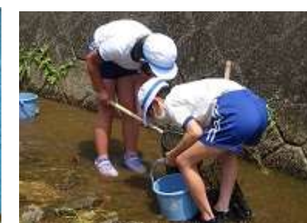
総合：美川の環境を守る（水質調査）