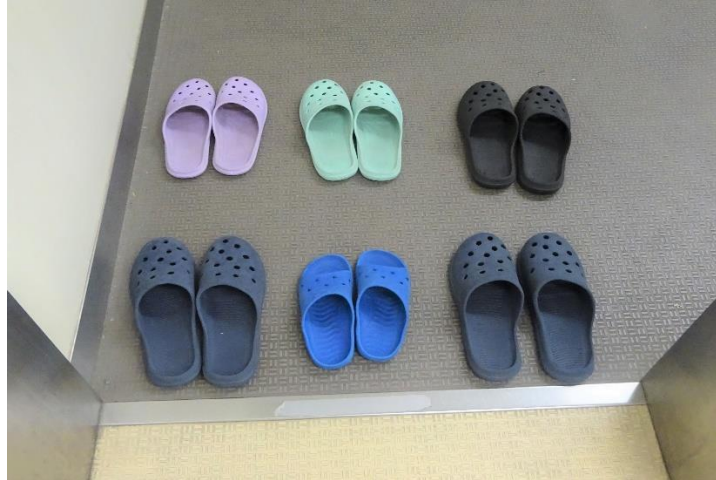
【きれいに揃えられたトイレのスリッパ】

この写真は、5月のある日の長浜小学校2階にある男子トイレのスリッパの様子です。どう思われますか？きれいに揃っていますよね。もちろん、長浜小学校のトイレのスリッパがいつでもこんなにきれいに揃っているわけではなく、驚くほど乱れている時もあります。ですが、この日は違っていました。この日、スリッパをこのように揃えてくれたのは2年生の一人の男の子でした。いつものように、各学級に朝の挨拶をしながら校舎内を歩いていると、2階男子トイレの入り口で、一人の男の子がうずくまって何かをしていました。私は気分でも悪いのかと思って声を掛けようと近づいてみました。するとその男の子は、床に膝をつき、1足ずつ丁寧にスリッパを揃えてくれていたのです。私はびっくりしました。そして、驚くとともに、長浜小学校にこんな素敵な子どもがいることを、ほんとに嬉しく思いました。