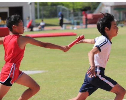
陸上大会：思いを込めたバトンパス