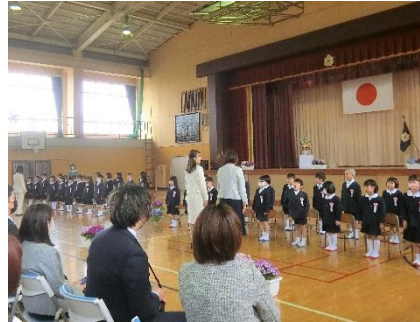
入学式：希望にあふれた38人の1年生

243名の長浜っ子は、この1学期、毎日明るく、元気に、そして何事にも一生懸命に取り組みました。自分たちで掲げた児童会スローガン【え・が・お：えがお かがやく おもいやる長浜っ子】の実現に向け、みんな頑張った1学期でした。243名それぞれに、自分のもっているよさを大きく伸ばし、成長しました。その成長の源になったものは、長浜っ子がもっている素直な心と、伸びようとする向上心だったように思います。長浜っ子はきらきら輝きました。