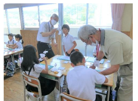
八朔祭りの花づくり：伝統を学ぶ