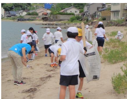
海岸清掃：長浜のきれいな海を守る