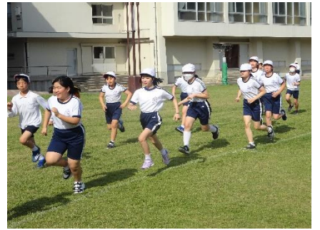
陸上練習：自分の限界に挑戦