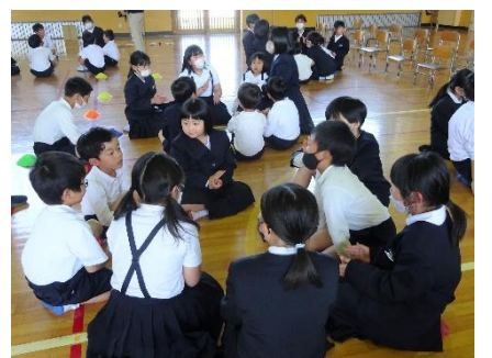
1年生を迎える会：全校みんなで歓迎