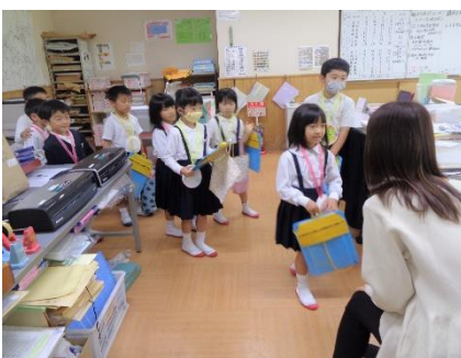
学校探検：2年生が1年生を案内