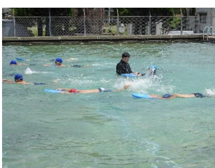
水泳学習：自分の目標に向かって