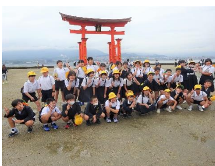
修学旅行：世界遺産・宮島にて