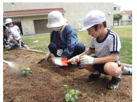
野菜の苗植え：地域の方といっしょに