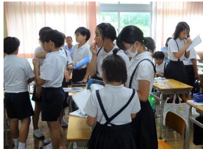
【お互いの考えを聞き合う6年生】

このような子どもたちの姿を目指していくためには、主体的に解決に向かいたくなる【問いの工夫】と、対話によって生まれる【深い学び】が大切になると考えます。そのような授業こそ、子どもたちが「楽しい」と思える授業だと思うのです。「わかって楽しい」、「できて楽しい」と、子どもたちが自らの伸びを実感することによって得られる「楽しさ」を感じることができる算数の授業を目指していきたいと思ひます。