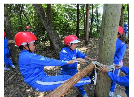
宿泊研修：仲間との協力・協働