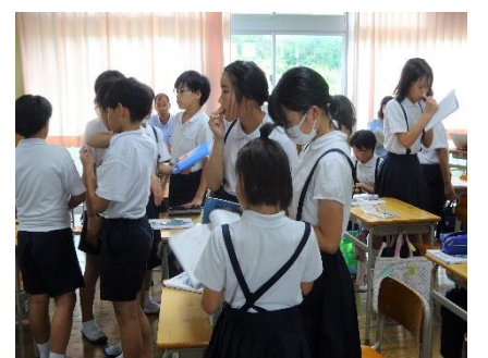
公開授業：仲間とともに学ぶ