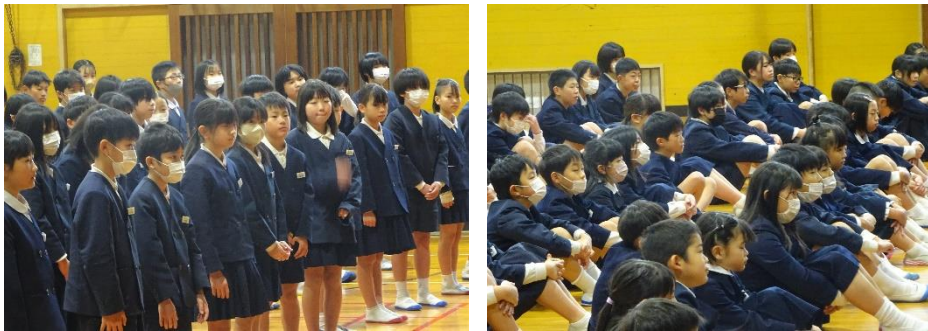
<始業式で話を聞く子どもたち>

〇〇の中には、「まとめ」「準備」という言葉が入ります。1・2学期を振り返り、自分のそして自分達の成長や課題を確認してほしい、そして、次の学年に向けて、心も体も頭もしっかり準備してほしいと伝えました。話を聞く子どもたちは、姿勢を正し、真っすぐに顔を前に向け、私の話をうなずきながら聞いていました。その姿は凛としていて、やる気に満ち、長浜小学校の2024年が素晴らしいものになると思わせてくれる立派なものでした。