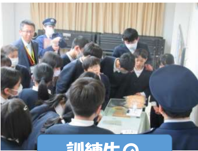
訓練生のお食事の見本