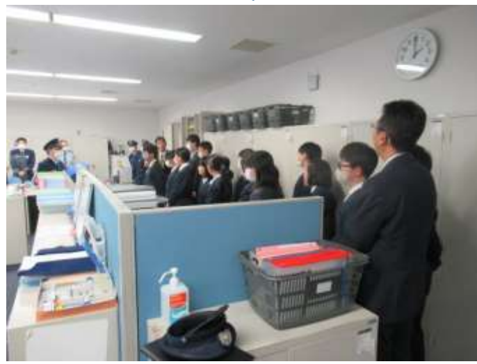
職員の方がどんなお仕事をされているのか見学し、説明していただきました。

1周720mの廊下を歩き、離れたところから訓練生の作業されている様子を見学しました。また、現在は使用されていない訓練生の居住エリアも見学しました。