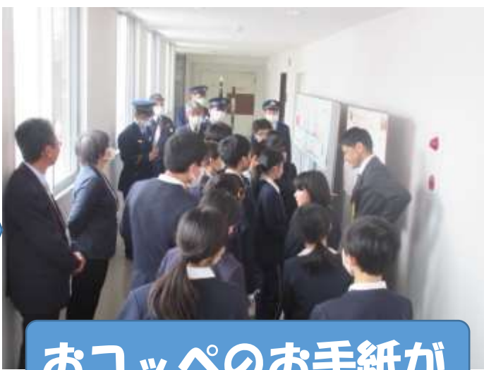
おコッペのお手紙が掲示してありました