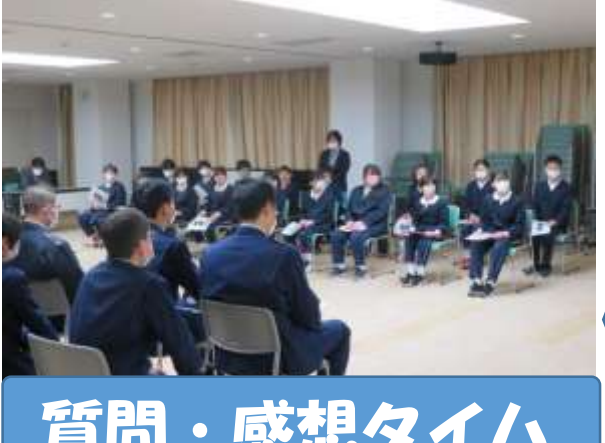
質問・感想タイム