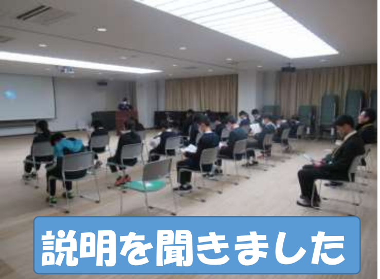
説明を聞きました