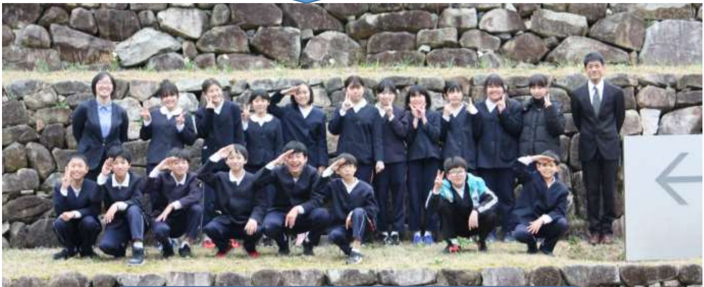
帰りに水仙を見ました