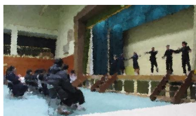
執行部企画パフォーマンス

最後は、卒業生から後輩や教職員へ心に響くメッセージがありました。大いに盛り上がり、在校生と卒業生それぞれの思いが届いた心温まる時間となりました。