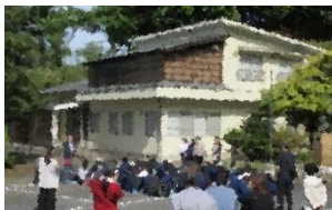
本郷生活改善センター

町内5地区のまちづくりセンター、旭分室、駐在所など温かく見守っていただいた地域の方々のご支援によって、普段はなかなか気づくことがおぼろしく魅力あふれる地域景色をスケッチし、安全に充実した活動を行うことができました。事前の準備など関係の皆様には大変お世話になりました。ありがとうございました。