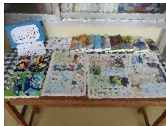
<図書館前～サッカー関係の本>