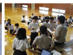
<校舎内でカード探しなど>