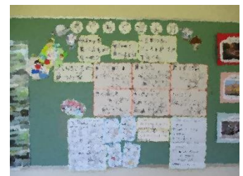
<ランチルーム前の掲示板>