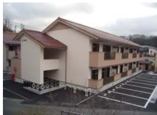
旭ヶ丘団地建替整備事業 (事業費1億4,858万円)