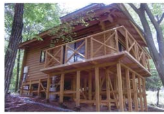
ふるさと体験村改修事業 (事業費1,453万円)