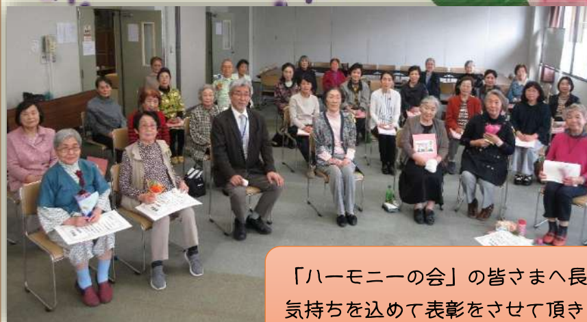
「ハーモニーの会」の皆さまへ長年の感謝の気持ちを込めて表彰をさせて頂きました。