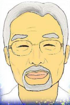
←センター長自画像

来館される皆さまやボランティアの方たち、とてもお元気で明るいお顔をされています。楽しさの輪が広がる優しさに満ちた浜田まちづくりセンターとなりますように。