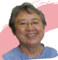
毛利 コーディネーター

私たちはその組織・チーム作りのきっか けづくりやお手伝い、講師、専門分野の 方を斡旋、紹介するなどのサポート役を 担います。