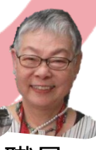
まちづくりセンター職員